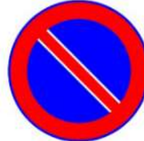
Park Yaptırmak Yasaktır